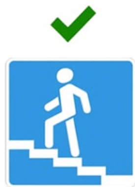
Надземный пешеходный переход