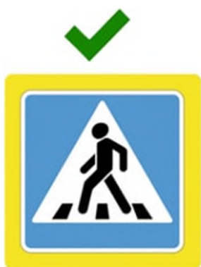
Наземный пешеходный переход

Он обозначен дорожными знаками «Пешеходный переход» и белыми линиями разметки «зебра».