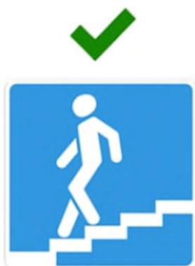
Подземный пешеходный переход